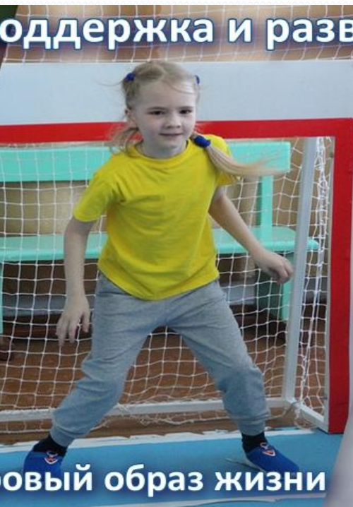
Здоровый образ жизни