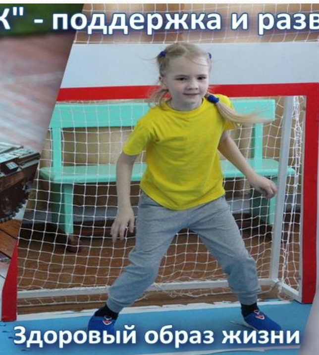
Здоровый образ жизни