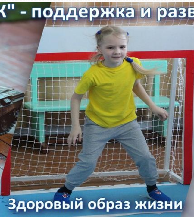
Здоровый образ жизни